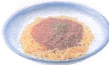
※写真はイメージです ベリーノホテル一関さん