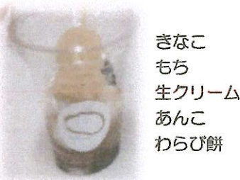
きなこもち 生クリーム あんこ わらび餅