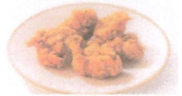
山小特製パッケージ入り ※写真はイメージです オヤマさん