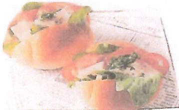
※写真はイメージです ベリーノホテル一関さん