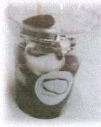
チョコもち 生クリーム わらび餅