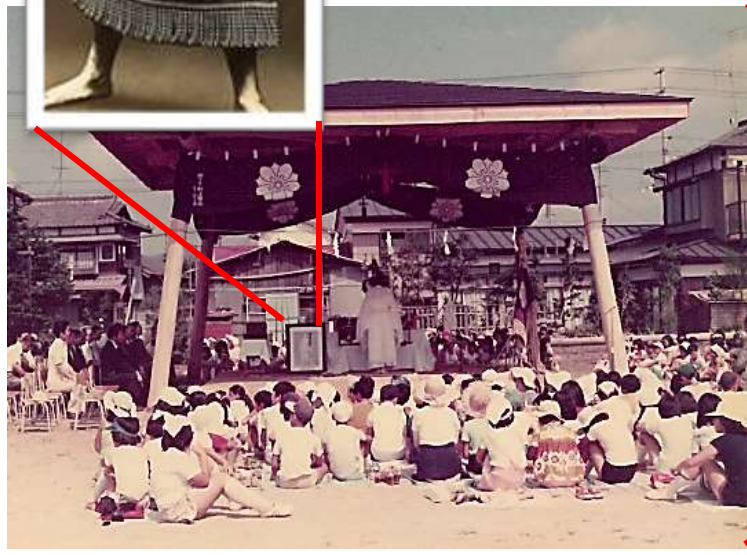
【相撲場落成式 昭和 51 年 7 月 28 日】

そして、よく見ると、神主さんの左側に写真が飾られています。明治 28 年（1895）、山目五代で生まれ育った第 29 代横綱の宮城山福松（みやぎやまふくまつ）さんです。地元出身のヒーローにちなんだ相撲場なのですね。