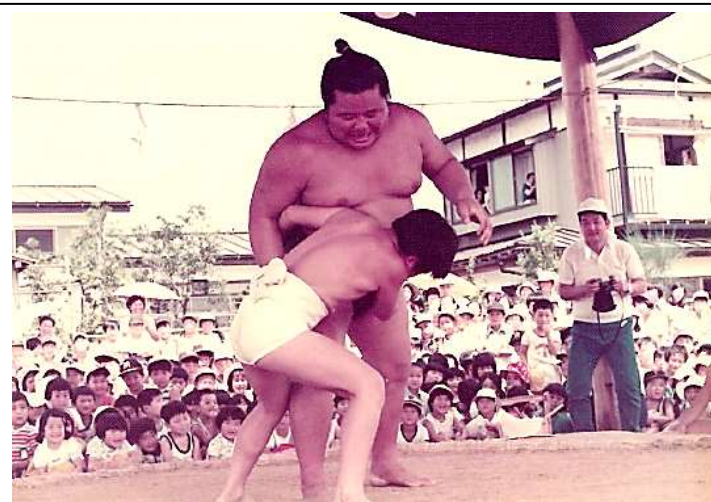
【力士と児童の相撲】

横綱宮城山が生まれた家と力士としての功績は、今も五代町に残されています。詳しくは、「山目村の誇り・横綱宮城山福松」で検索してみてください。