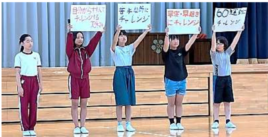
【児童朝会 夏休みのスローガンを確認】

小さなことでも、お子さんが自分から挑戦したこと、努力したことを認め、ほめることが、やる気と自信につながります。よろしくお願いします。