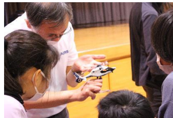
【ヘリの模型を使って説明】

夢と志を力に、世界の空で活躍される小野寺先輩とAHJの皆さん、とても輝いていました。