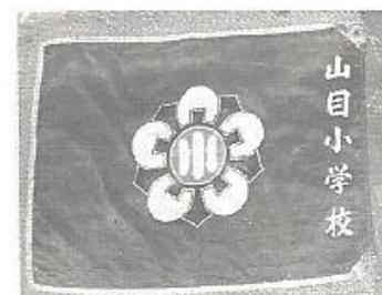
蘭と梅（蘭梅） 中央に小の文字、上の花卉 1 枚