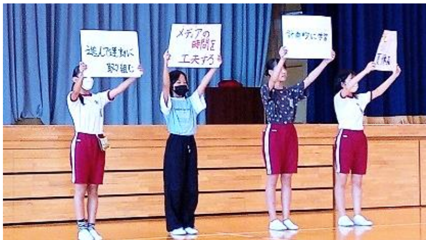
【児童朝会 夏休みのスローガンを確認】